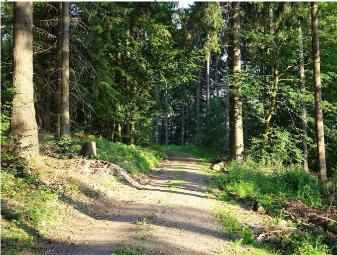
Im Wald am Engelner Kopf