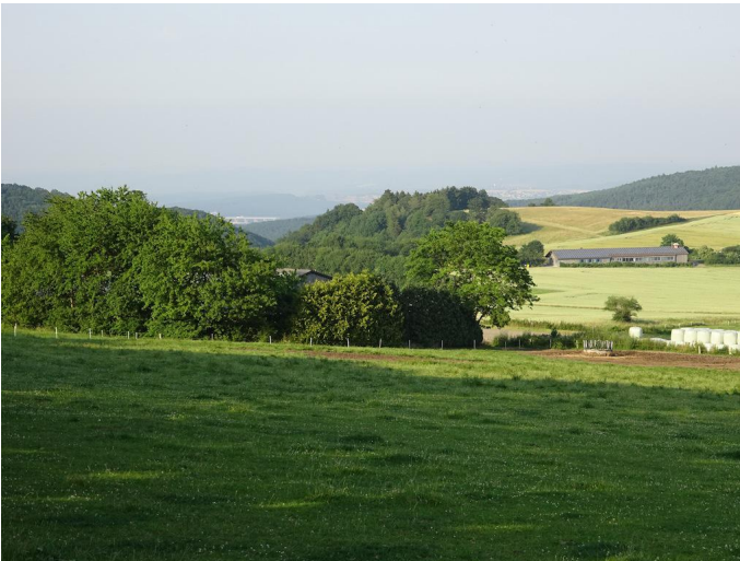
Blick oberhalb von Engeln ins Brohltal