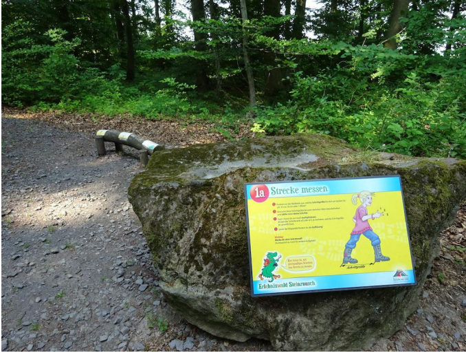
Ziel erreicht: Erlebniswald Steinrausch