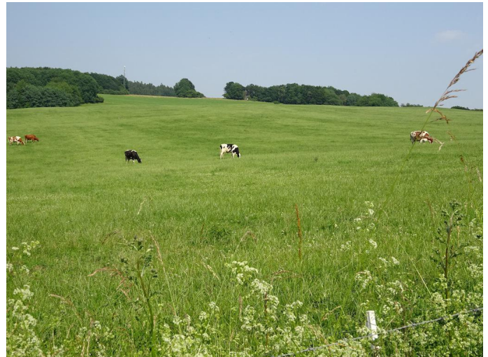
Durch ausgedehnte Weidelandschaften geht es Richtung Kempenich.