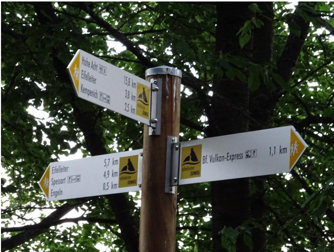
Folgen Sie dem Beschilderungssystem der Eifelleiter.