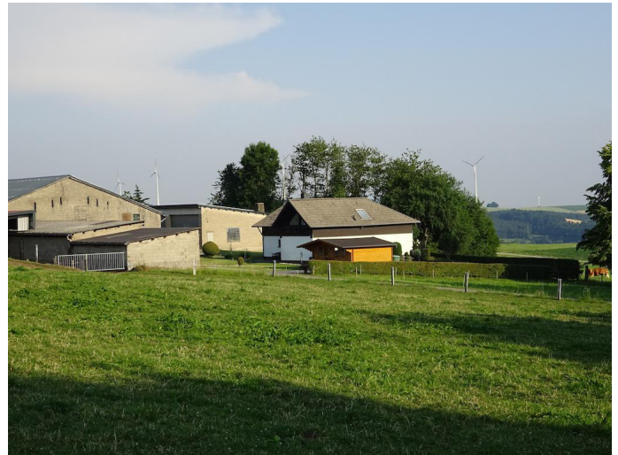
Die Rottlandhöfe Autor Michael Hergarten Quelle outdooractive.com-Community