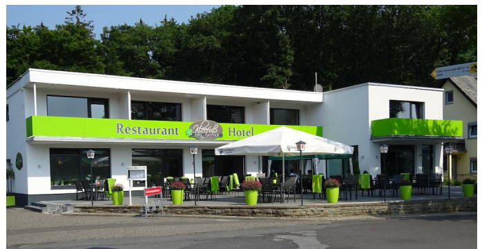
Kurz vor dem Ziel liegt der Eifel-Gasthof Kleefuß am Wegesrand.